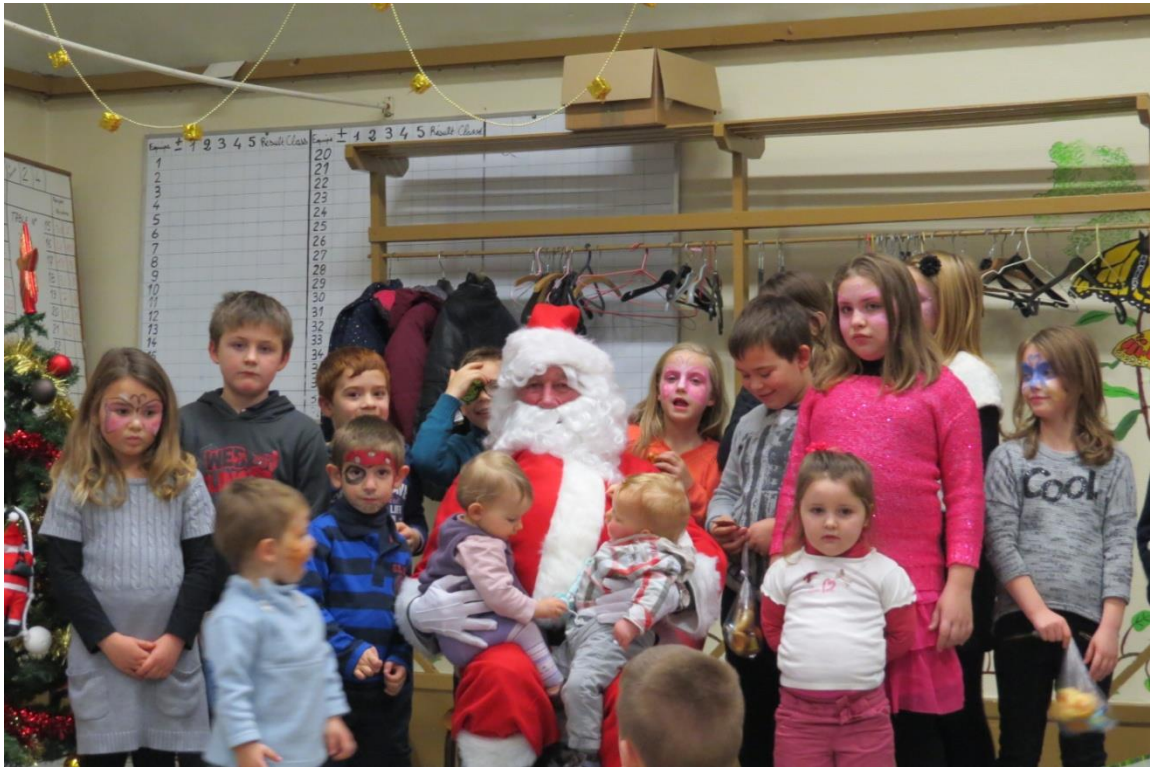
Les enfants de Larouillies

Nous vous proposons de nous retrouver en 2015 aux dates suivantes :